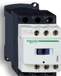
vybrané stykače TeSys

| Akce bude zahájena v průběhu února 2021 a bude probíhat do vyprodání zásob. | Akce probíhá pouze u vybraných partnerských velkoobchodů. | Akce se vztahuje pouze na jednorázový nákup vybraných produktů řady Harmony a TeSys v cenách bez DPH, který je realizován za standardních obchodních podmínek. | Vyobrazené produkty jsou informativní. | Podrobné informace naleznete na www.eplus.schneider-electric . | Organizátor si vyhrazuje právo na změnu podmínek akce. |