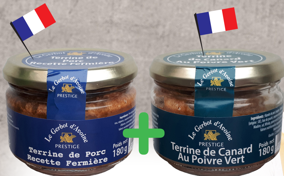
Farmářská vepřová terina