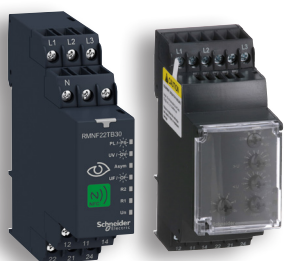
vybraná kontrolní relé Harmony