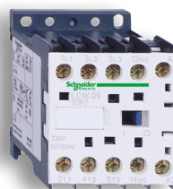
vybrané ministrykače TeSys