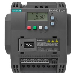
Podobné zobrazení Figure similar